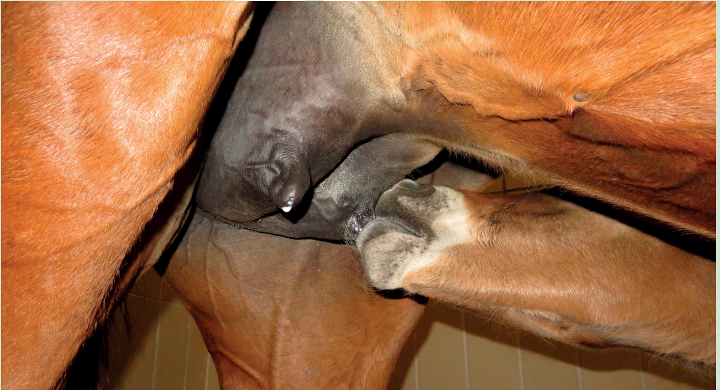
Een veulen dat snel na de geboorte opstaat en direct vlot drinkt heeft een goede start.

in elkaar zakt - iets dat veroorzaakt kan worden door te kort aan slaap) had deze problemen wel in de winter, maar niet in de zomer. Toen het paard door omstandigheden in de winter een paar weken lang overdag toch in de wei mocht, verdween de narcolepsie ook in de winter. Daarbij was het de eigenares opgevallen dat het paard 's middags in de wei altijd een uurtje lag te slapen en binnen eigenlijk nooit lag. Toen het paard binnen een duidelijk grotere box kreeg, waar hij 's nachts wél regelmatig lag, verdwenen de symptomen van narcolepsie volledig.