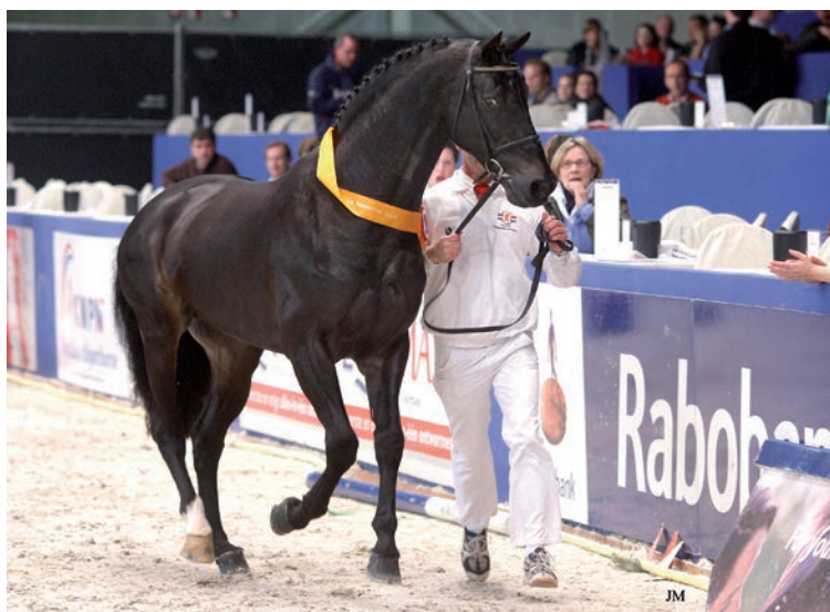
Onlangs verkocht Stal Roelofs de helft van keurhengst Namelus R (v.Concorde) aan Stal Eurocommerce. Hij staat bekend om de vererving van veel springaanleg en bloed.