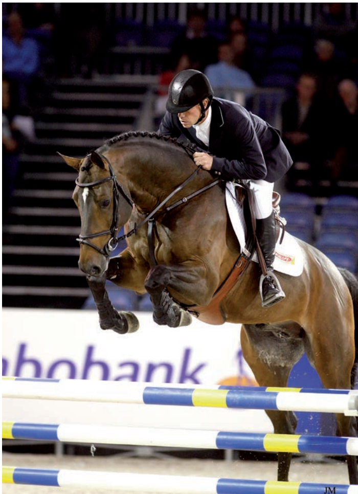
Eén van de paradedpaardjes van Stal Roelofs is Arthos R, die in 2008 kampioen van de hengstenkeuring was en nu in de sport hoge ogen gooit.