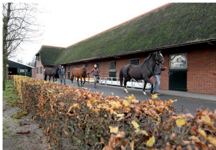
Het aantal fokmerries is teruggebracht naar 18, waaronder deze drie genetisch hoogwaardige merries W.Termie (v.Contender), U.Rubertha 15 (v.Contender) en N. Ruberth 14 (v.Voltaire).