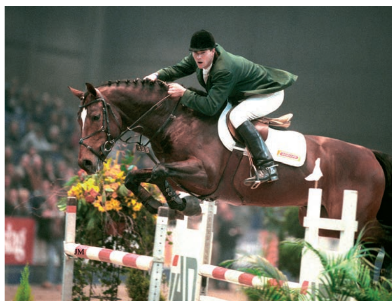
Keurhengst Mermus R (v.Burggraaf) is verkocht naar Ierland, waar hij de afgelopen twee seizoenen meer dan 200 merries bediende.